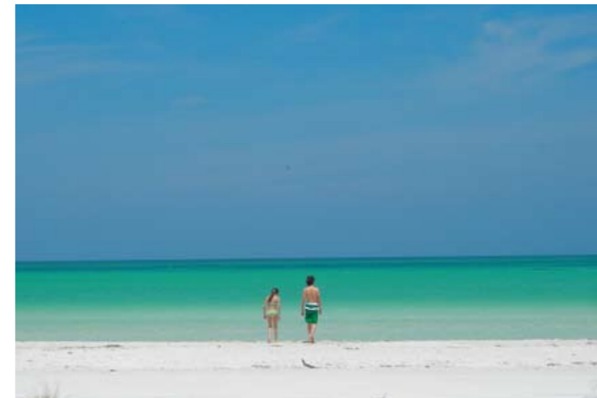
La isla apenas mide 40 km de largo por 2 de ancho.

■ Más información: Xaloc Resort: holbox-xalocresort.com ; Hotel Mawimbi: mawimbi.net . Hotel Casa Sandra: casasandra.com . Vuelos a Cancún desde 200 dólares con Mexicana. ■ Paga a la antigüita: La vida en Holbox es tan básica que no hay cajeros automáticos en la isla y muchos lugares no aceptan tarjetas de crédito. Así es que lleva suficiente efectivo para que no tengas ningún percance durante tu estancia.