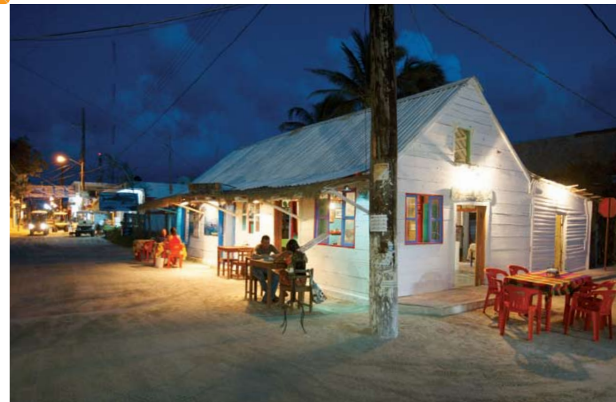
Una de las típicas cabañas de Holbox, para comer o cenar.